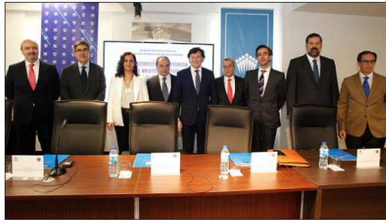
Mesa redonda sobre el futuro del baloncesto español

Madrid, 6 Mar. 2018.- La nueva sede de ISDE en la calle Serrano acogió la mesa redonda “El baloncesto español: el futuro de sus competiciones”, que sirve como presentación del curso 2018 del Máster en Gestión y Derecho del Deporte que organizan ISDE y el club Movistar Estudiantes.