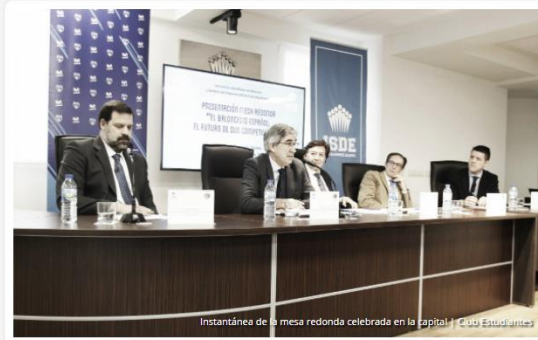
Instantánea de la mesa redonda celebrada en la capital | Movistar Estudiantes

Desmarcándose de la tónica habitual de los equipos en los que poco más que el baloncesto y transcurso de las semanas es lo relevante, Movistar Estudiantes continúa con su base de hacer grande al baloncesto español apostando por su futuro . Esta vez, haciendo público un nuevo Máster en Gestión y Derecho del Deporte a través de ISDE, lo cual ha traído consigo la celebración de una mesa redonda en