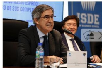
Jordi Bertomeu, en la imagen junto a José Ramón Lete, presidente del CSD, en un acto celebrado en Madrid.

El presidente de la Euroliga, Jordi Bertomeu , aseguró ayer que «no hay conflicto con la FIBA» pese al continuo desencuentro con el calendario internacional y que «el problema es el calendario de la FIBA, incompatible con la realidad del baloncesto en el mundo», lamentando que le parece «horroroso que las selecciones nacionales jueguen sin sus mejores jugadores» y ofreciéndose a «hacer 14 propuestas más si es necesario» para arreglar el problema.