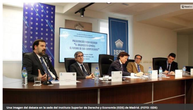
Una imagen del debate en la sede del Instituto Superior de Derecho y Economía (ISDE) de Madrid.

Comparte en Facebook | Comparte en Twitter | Envía por Email