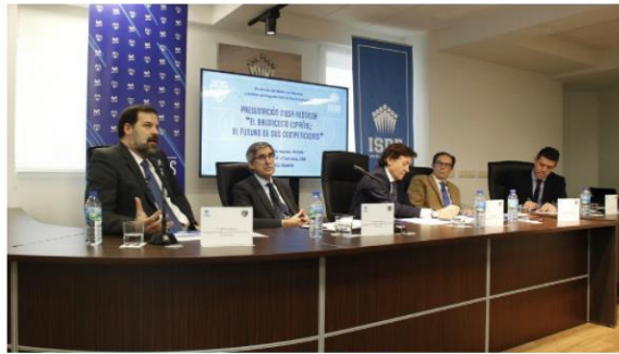
Un momento de la mesa redonda organizada en la sede del ISDE sobre el futuro del baloncesto. Club Estudiantes