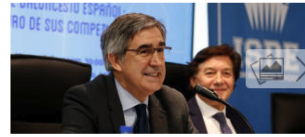
Jordi Bertomeu, durante el acto de este martes.

El presidente de la Euroliga, Jordi Bertomeu , ha asegurado que "no hay conflicto con la FIBA" pese al continuo desencuentro con el calendario internacional y que "el problema es el calendario de la FIBA, incompatible con la realidad del baloncesto en el mundo", lamentando que le parece "horroroso que las selecciones nacionales jueguen sin sus mejores jugadores" y ofreciéndose a "hacer 14 propuestas más si es necesario" para arreglar el problema.