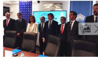
El CSD actuará si no hay acuerdo con los ascensos a la Liga Endesa

El presidente del Consejo Superior de Deportes (CSD), José Ramón Lete, ha avisado de que, "si no hay un acuerdo" entre la ACB y la FEB para aclarar el número de ascensos y descensos para la próxima temporada en la máxima categoría del baloncesto español, su organismo intervendrá "con sentido de la responsabilidad y sentido de la proporción" para resolver el asunto.