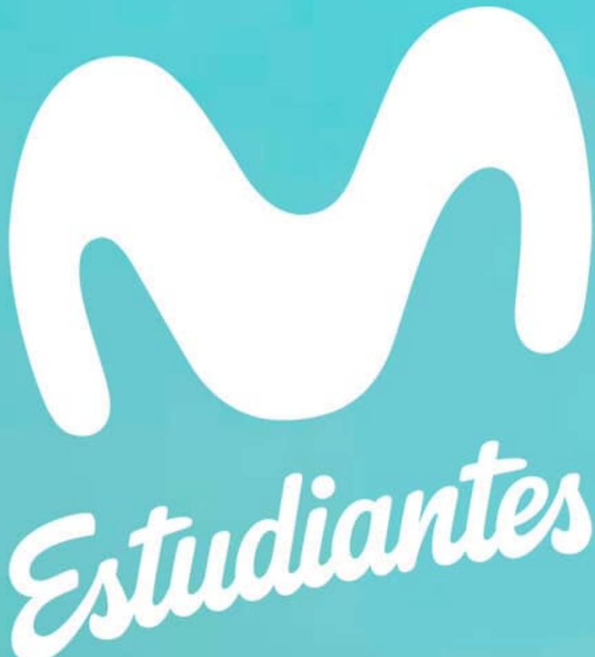
Fondos lisos y texturas.