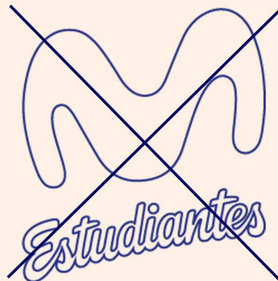
Logo solo contorno