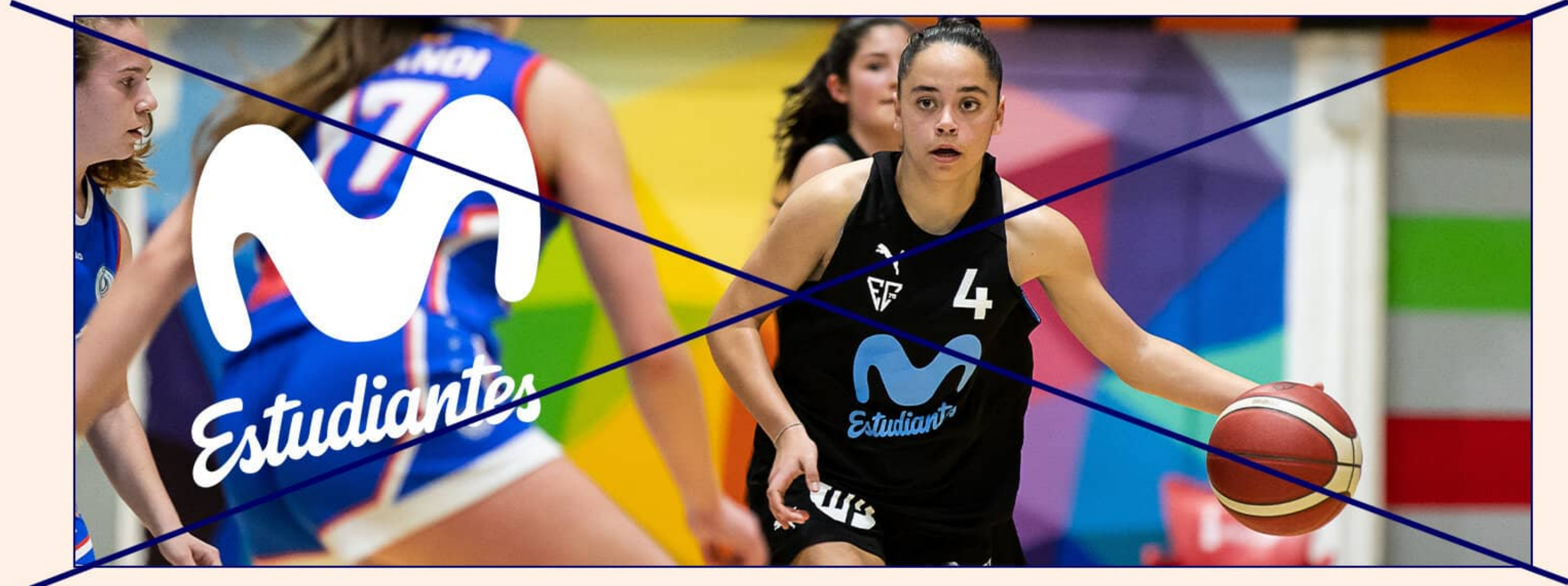
Logo positivo o negativo en fondo no liso.