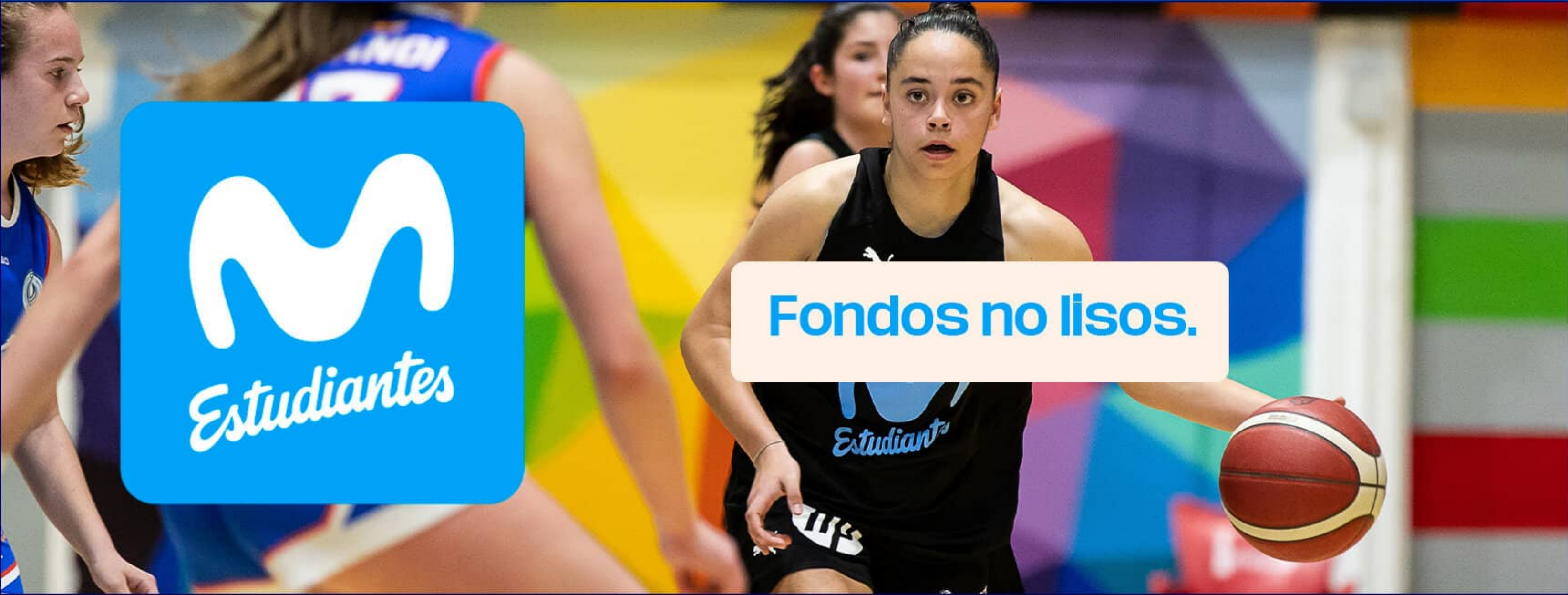
Fondos no lisos.