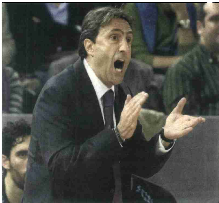
Casimiro no sigue. El Estudiantes le comunicó ayer su destitución