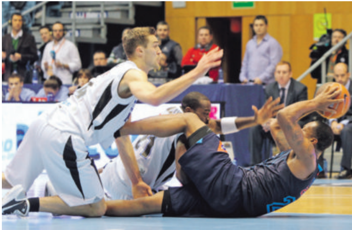
El Obradoiro tocó fondo en la primera parte, pero reaccionó tras el descanso para firmar la cuarta victoria del curso. PACO RODRÍGUEZ

Superó al Estudiantes tras el descanso gracias a una gran defensa