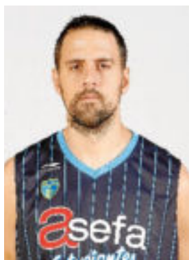
G. Gabriel.