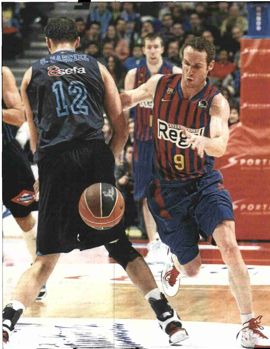
Huertas le hace un 'caño' a Gabriel. El Barça Regal supo rematar el partido en la recta final

Desde la óptica azulgrana, los de Xavi Pascual sudaron un triunfo