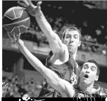
Ganó el poderío azulgrana