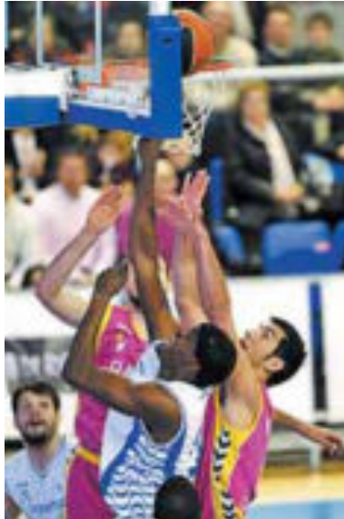
Koné lucha por un rebote.

El Banca Cívica no supo imponerse ante el Baloncesto Lucentum, que ascendió a la cuarta plaza de la ACB tras doblegar al equipo de Joan Plaza (86-82) en un trepidante e igualado partido que se decidió tras una prórroga. En el tiempo extra, el Banca Cívica llegó a contar con cuatro puntos de renta, pero no los supo administrar. El acierto en el lanzamiento de tres permitió al Lucentum comandar el marcador en el primer cuarto. Los de Plaza no sólo dieron cumplida réplica desde la línea de 6,75 metros, sino que mejoraron sus números y ya en el tercer cuarto, Paul