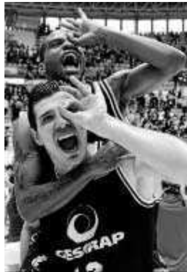
Bilbao ganó de uno.

El FIATC Joventut dio la sorpresa de la jornada al imponerse (66-68) al Caja Laboral en Vitoria en