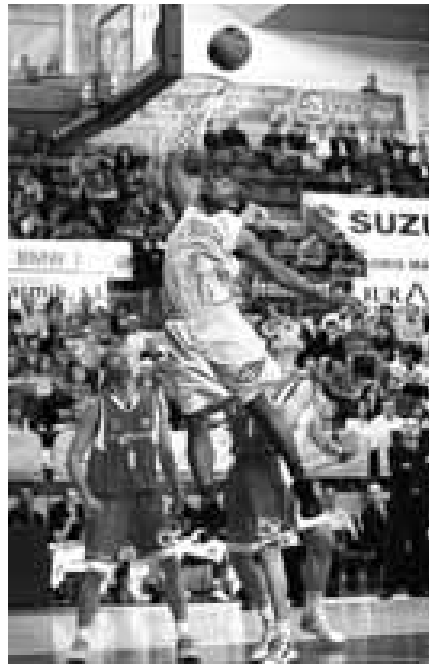
Deane deja la bandeja.

El conjunto local se mostró muy superior en el primer cuarto gracias a la efectividad anotadora de Doellman, pero el Estudiantes empezó a reaccionar a