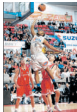
Traspie de Deane y del Estu.

▲ CANCHA: Nou Congost (Manresa); 4.050 esp. ▲ ARBITROS: García Ortiz, Perea y Martínez. ▲ ELIMINADOS: No hubo.