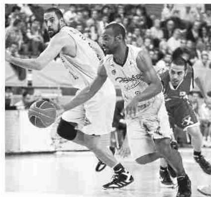
Los colegiales, en estado crítico

Un parcial de 10-0 dio la vuelta a la tortilla (67-62, m.33). Clark mantuvo al Estudiantes, pero des- pués de anotar Granger el 78-75, no volvió a ver el aro.