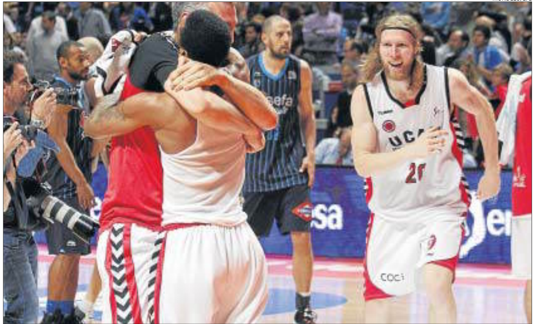
Los jugadores del Murcia celebran la salvación ante un Estudiantes que mandaron a la LEB Oro.

[MADRID] El Asefa Estudiantes consumó ayer el primer descenso de su historia al perder ante el UCAM Murcia (80-86), que salvó la categoría en esta última jornada, mientras que el Lucentum Alicante completó la fase por el título al ganar al Fuenlabrada (66-55) y colarse en la octava plaza. El equipo madrileño necesitaba ganar y, dependiendo de la combinación de otros resultados, hacerlo por catorce puntos. Hubo momentos que pareció tenerlo en su mano, pero un último cuarto nefasto del conjunto de Trifón Poch les condenó al primer descenso en sus 64 años de historia. El conjunto co-