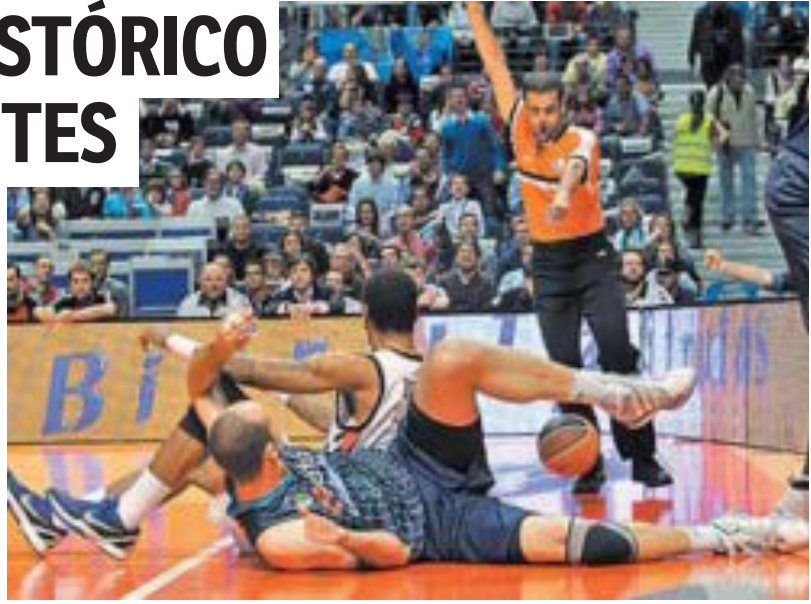
Cruel despedida para un jugador con una brillantísima carrera.

No hubo milagro. Asefa Estudiantes necesitaba ganar por más de trece puntos al UCAM Murcia, y esperar a que el CAI ganase su partido para no perder la categoría en la ACB... Y ni una cosa ni la otra. Los colegiales cayeron ante los murcianos, y Carlos Jiménez vivió su último partido, y quizá el más triste. P17