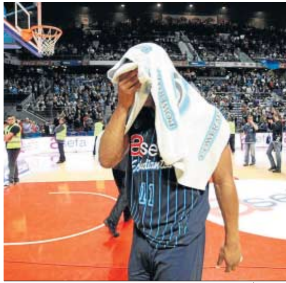
Granger se retira con el rostro cubierto por una toalla.

El club local necesitaba las victorias de CAI y Fuenlabrada en Santiago y Alicante, respectivamente, o la de uno de ellos y entonces vencer por 14 al Murcia. Llegó a tener once de ventaja, pero el cansancio, la tensión y, sobre todo, el Murcia, pudieron con él.