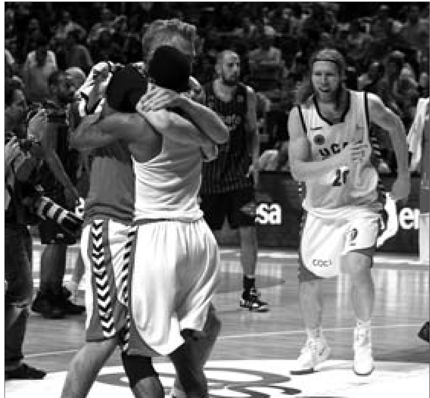
Los jugadores del Murcia se abrazan tras salvarse.

El partido discurría con una ventaja que oscilaba entre los ocho y los 11 puntos para los del Ramiro, que, en vista de las derrotas de Fuenlabrada y Blusens Mombus necesitaban ganar, al menos por 14 tantos. Al final del tercer parcial la renta de los madrileños era de 7 puntos. Una ventaja que se fue diluyendo en un mal último cuarto de los de Trifón Poch, algo que fue aprovechado por los murcianos para ajustar el marcador y ponerse un punto. Finalmente, los colegiales se vinieron abajo en un nefasto último cuarto en el que encajaron un 12-25 que resultó decisivo. Fuenlabrada, que aunque cayó ante el Alicante en el Centro de Tecnificación, resultó favorecido por los resultados del resto de equipos que se jugaban el descenso. Los alicantinos lograron así meterse en la ronda por el título.