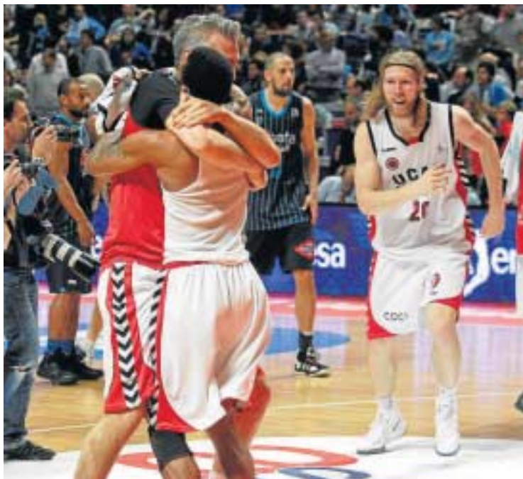
Los jugadores del UCAM Murcia celebran la permanencia en la ACB.

Hubo momentos que pareció tenerlo en su mano, pero en un último cuarto nefasto el conjunto de Trifón Poch, al ver que la empresa era cada vez más complicada, echó el trabajo por la borda, lo que aprovechó el UCAM Murcia para remontar, llevarse el partido y la permanencia en plena tragedia de la afición que llenó el Palacio de los Deportes y que dio una auténtica