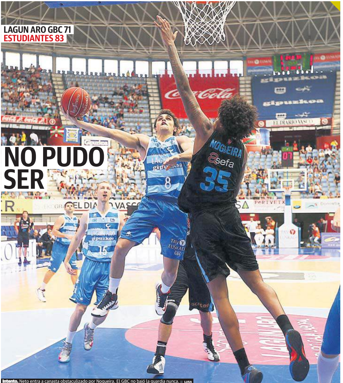
Intento. Neto entra a canasta obstaculizado por Nogueira. El GBC no bajó la guardia nunca.