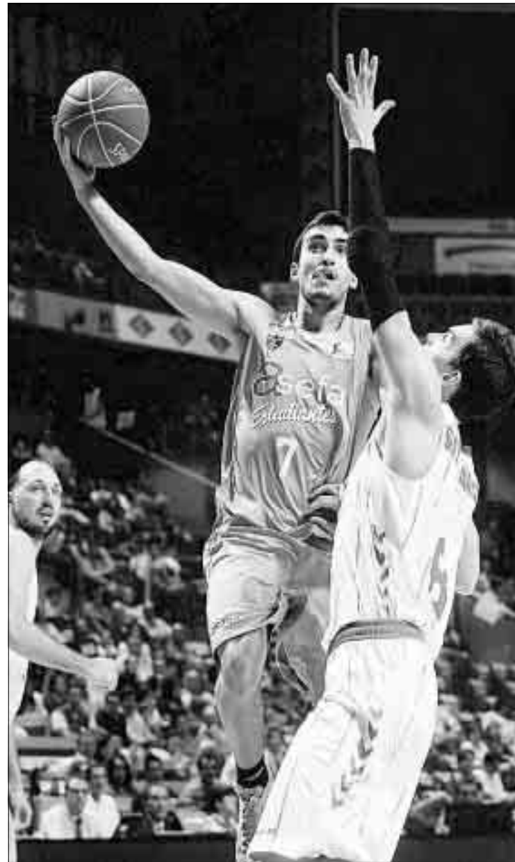
Rudy se topa con Marc Gasol. Quamquo horae, condiestrus omnem con di facibus inatus nostame catus; Casto inam patisuas villabuliam

Hay un puñado de equipos que todavía no ha estrenado su casi-