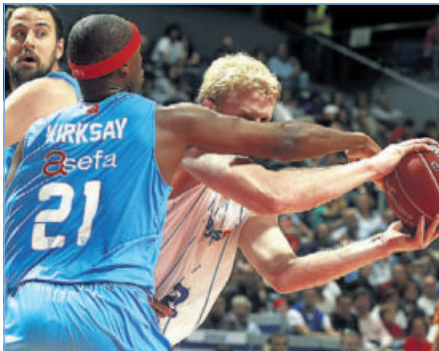
El Estudiantes dio un repaso al conjunto sevillano