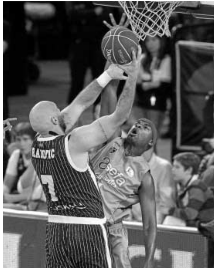
El estudiantil Kirksay frena con un tapón al local Rakovic.

La reanudación trajo consigo la reacción de los de Sito Alonso, dispuestos a vender cara su piel. El choque se convirtió en un intercambio de canastas. Hamilton fue el hombre más destacado de los bilbaínos, que al finalizar el tercer cuarto ya ganaban por un solo punto (62-61). El final fue de infarto y un triple de Vasileiadis brindó al Gescrap Bizkaia una importante victoria in extremis (86-85).