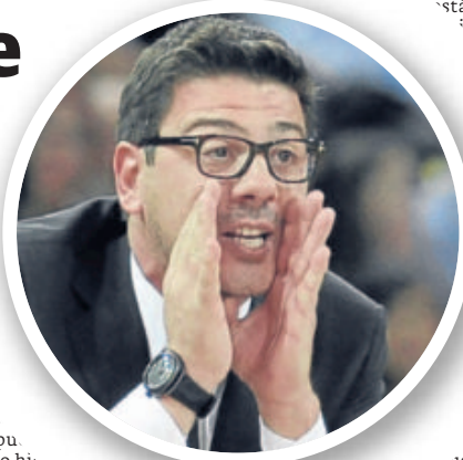
mov... durante el partido.

un tío duro que ay mucho y seguro lo hará todavía cuando se afia más en el equipo momento, para tiene el aprobado El nombre del bio fue coreado p afición poco despu que Txus Vidorreta biera su segunda ova en la capital vizcaína técnico visitante, despu que hace varios meses lo hic como técnico del Lucentum Al. cante. El '7' de los hombres de negro no salió de inicio, lo hizo cuando quedaban 2.28 minutos para que finalizara la primera par-