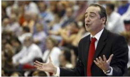
Foto: Txus Vidorreta, entrenador del Asefa Estudiantes.

"Es un partido muy difícil porque jugar en Manresa siempre es complicado. Assignia Manresa siempre hace muy buen baloncesto y este año aunque no tengan ningún triunfo lo están haciendo. Se le han escapado partidos que tenía ganados contra Blancos de Rueda o Lagun Aro; y la semana pasada compitieron hasta el final contra el Real Madrid ", explicó Vidorreta.