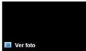
Txus Vidorreta, entrenador del Asefa Estudiantes.

Madrid, 23 nov (EFE).- Txus Vidorreta, entrenador del Asefa Estudiantes, aseguró que "jugar en Manresa siempre es complicado" y desechó cualquier conato de debilidad por el hecho de que el equipo catalán sea último de la clasificación y todavía no haya ganado partido alguno.