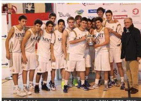
El Real Madrid fue campeón en la edición de 2011.

En 2011, con las instalaciones deportivas del Canal de Isabel II como