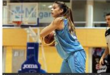
La joven base es una de las referencias del equipo colapsal.

El año pasado estuve lesionada y fue un año bastante complicado. La