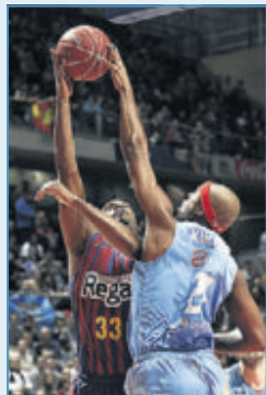
El Barça hizo ayer el ridículo