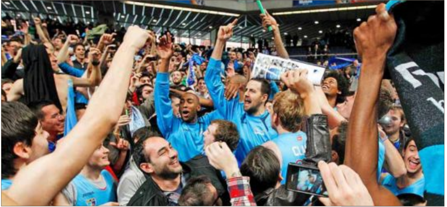
Los jugadores del Estudiantes celebran, junto a los aficionados, la clasificación para la Copa, ayer.