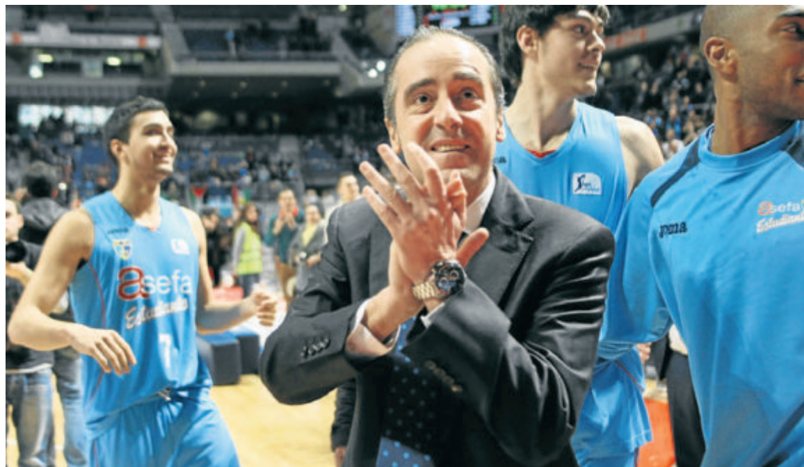
Como hizo el año pasado con el Lucentum Alicante, Txus Vidorreta ha repetido éxito metiendo al Asefa Estudiantes en la Copa.

El Unicaja estuvo unos minutos clasificado y el Barcelona llegó a estar a trece puntos de quedarse fuera de la cita de Vitoria