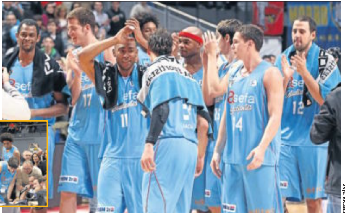
FIESTA COLEGIAL. Los jugadores del Estu celebran la clasificación para la Copa; antes, estuvieron pendientes del Joventut-Obradoiro.