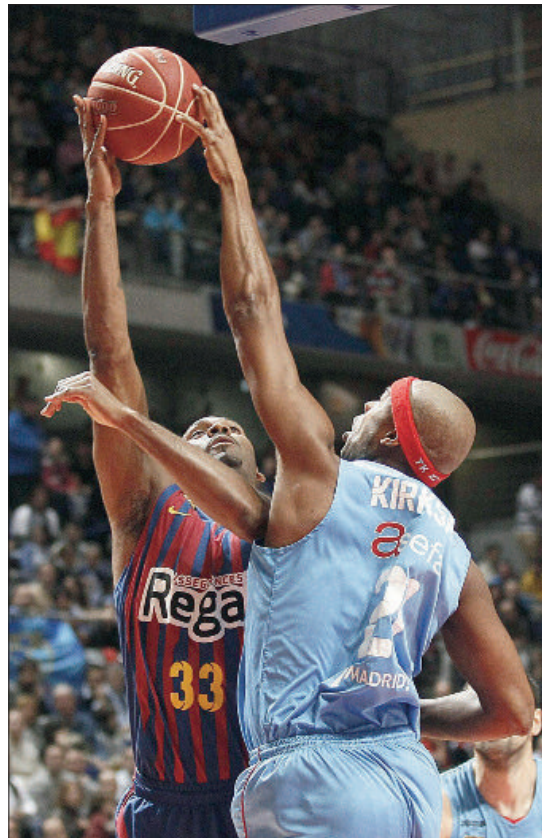
El partido Asefa Estudiantes-Barça Regal jugado ayer.

Un gran tercer cuarto de la Penya daba la vuelta al marcador. Los 28 puntos de Gaffney impulsaron a su equipo a llegar al último cuarto con ventaja (68-62). Sin embargo, los gallegos reaccionaron y, con unos últimos minutos espectaculares, consiguieron luchar hasta el último segundo. De