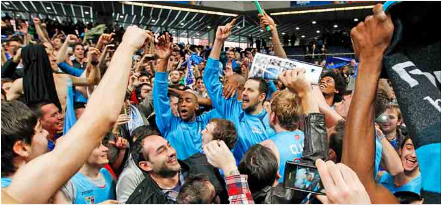
Los jugadores del Estudiantes celebran, junto a los aficionados, la clasificación para la Copa, ayer.