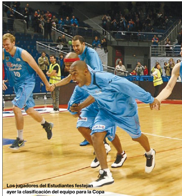
Los jugadores del Estudiantes festejan ayer la clasificación del equipo para la Copa