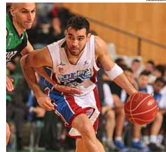
SORRISAS Y LÁGRIMAS Los jugadores del Asefa Estudiantes rieron los últimos. No hubo nada que celebrar en Málaga, donde Unicaja cayó ante el Cajal, ni en Badalona, donde el Blusens perdió y dijo adiós a la Copa.