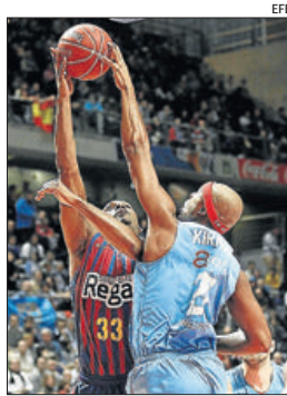
Kirsay tapon a Mickeal.

Por su parte, el FIATC Joventut se impuso al Blusens Monbus por 89-87 después de un emocionan-