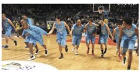
La plantilla madrileña celebra el triunfo y el billete para la Copa conseguidos ante una afición local que llevó en volandas a su equipo desde el pitido inicial.

El Asefa Estudiantes no encontró rival ayer en la decimoséptima jornada de la fase regular de la Liga ACB, al arrollar al Barcelona (88-66) en un choque marcado por el objetivo colegial de lograr un billete para la Copa del Rey de Vitoria. Un sueño que los madrileños lograron gracias a su victoria, pero, sobre todo, a la derrota del Blusens Monbus ante el FIATC Joventut (89-87).