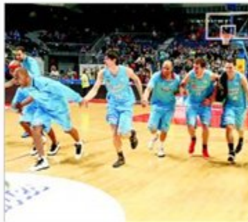
El Estudiantes festeja su clasificación.

Es la octava derrota del Barça Regal después de completarse las 17 jornadas de la primera vuelta. Pero, seguramente, es de la más dolorosa de todas las vividas en las últimas semanas para Pascual, porque su equipo perdió los papeles en el Palacio de Madrid en todos los sentidos.