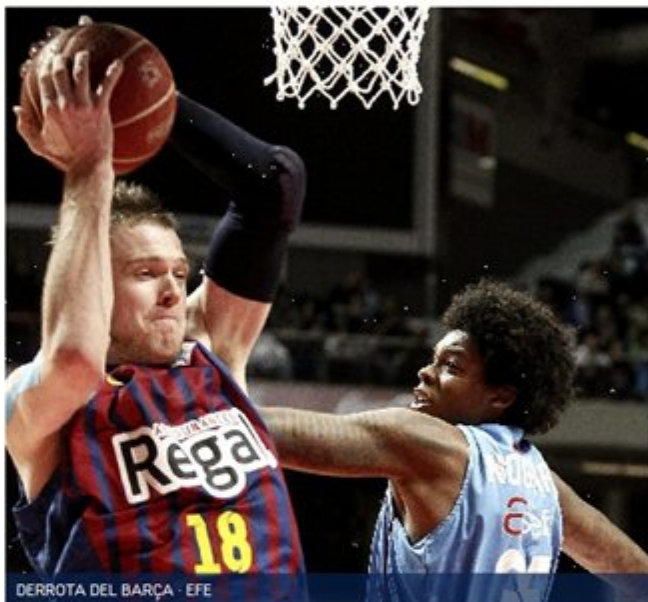
DERROTA DEL BARÇA