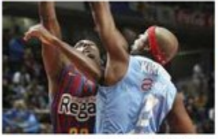
Kirsay tapon a Mickeal.