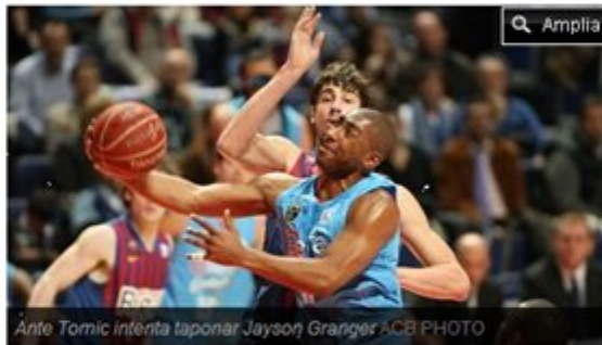
Ante Tomić intenta taponar Jayson Granger

El Barça Regal ha perdut a la pista de l'Asefa Estudiantes (88-66), on no ha sabut competir a bon nivell. L'equip blaugrana, que tot i la derrota s'ha classificat per disputar la Copa del Rei, ha tingut les baixes de Joan Carles Navarro, lesionat, i Joe Ingles, descartat abans de conèixer la baixa del capità.