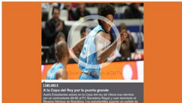
13/01/2013 A la Copa del Rey por la puerta grande Asefa Estudiantes estará en la Copa del Rey de Vitoria tras derrotar por un contundente 88-66 al FC Barcelona Regal y caer derrotado el Blusens Monbus en Badalona. Los estudiantes jugarán en el estadio de...

Machada del Estu, que mañana estará en el sorteo de Vitoria