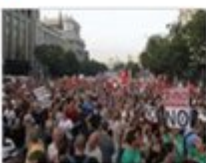
Clamor contra los recortes