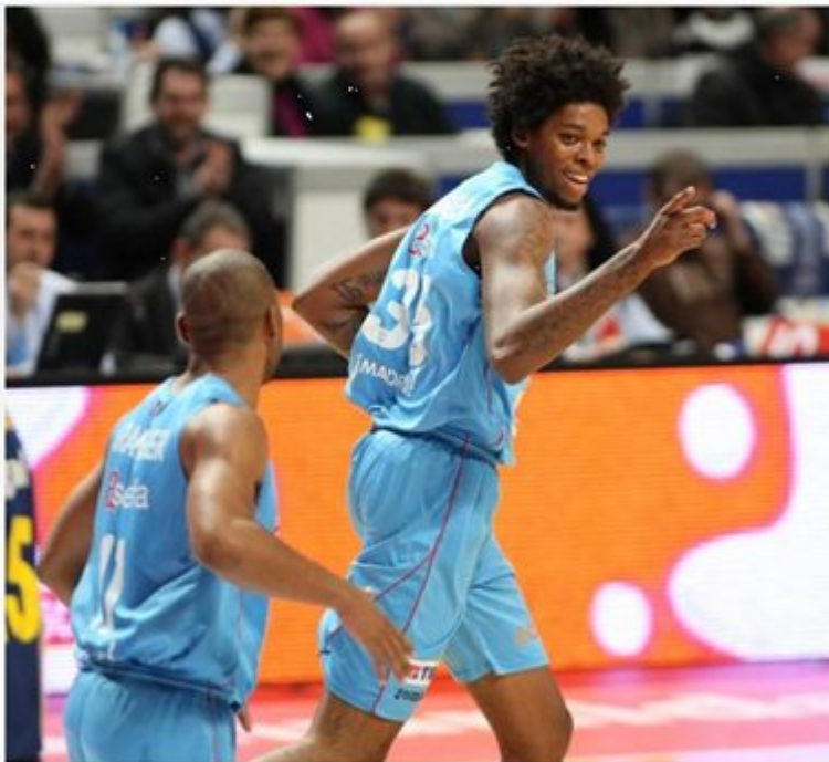
Crónica del Asefa Estudiantes-FC Barcelona Regal, 88-66

El sueño estudiantil destroza a un Barcelona sin su brújula