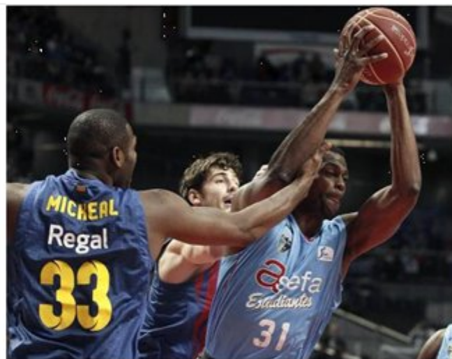
El Asefa Estudiantes consiguió ante el Barcelona una victoria que le clasifica para la Copa del Rey

Temas Asociación de Clubes de Baloncesto | Baloncesto | Pau Ribas | Real Madrid Club de Fútbol |