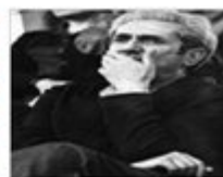
Huelgas generales en España