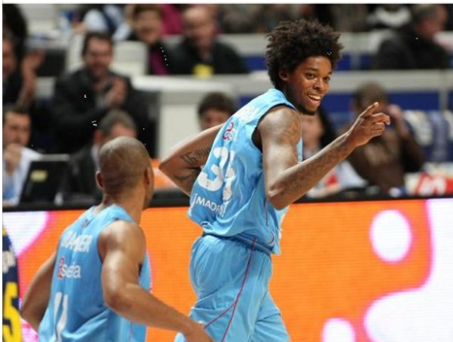
Asefa Estudiantes - FC Barcelona Regal