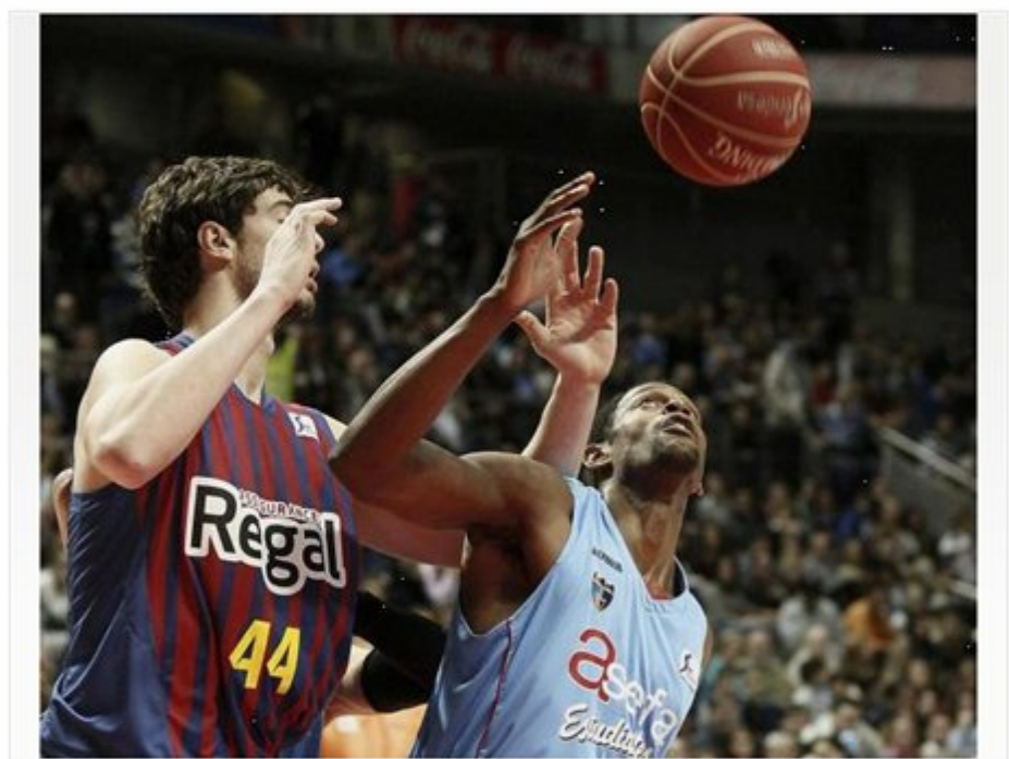
88-86. El Asefa Estudiantes consigue ante el Barcelona una victoria con corazón y con premio

Madrid, 13 ene (EFE).- Txus Vidorreta, entrenador del Asefa Estudiantes, se mostró más que satisfecho por haber conseguido su tercera clasificación para la Copa del Rey con tres equipos distintos y en cinco años, y reconoció que había hecho "un partido casi perfecto".