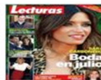
Quiosco de prensa; las revistas del corazón