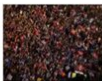
Huelga general 29M