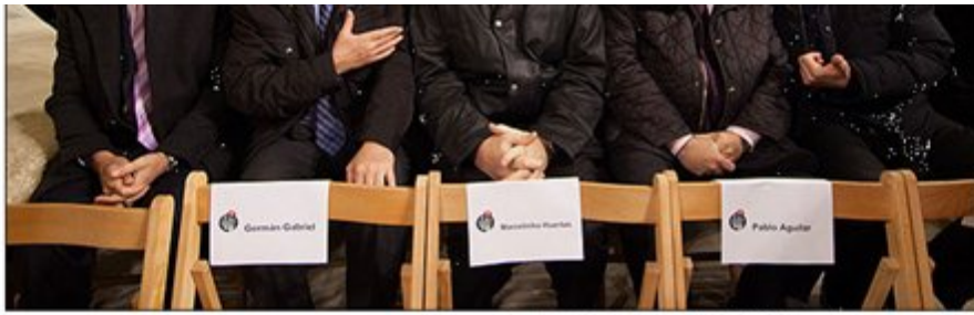
Los clubes, pendientes del sorteo