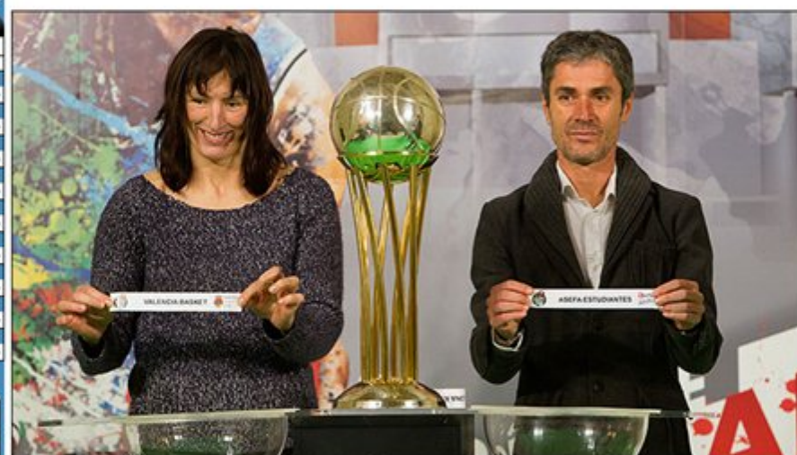
Valencia Basket - Asefa Estudiantes, emparejamiento en cuartos

Redacción, 14 Ene. 2013.- El Pórtico de la Luz de la Catedral de Santa María de la capital alavesa ha sido el magno escenario en el que ha tenido lugar el sorteo, con dos destacados nombres del deporte alavés ejerciendo de manos inocentes: Martin Fiz . Campeón del Mundo de Maratón, y Maidier Unda , la luchadora medalla de bronce en los Juegos Olímpicos de Londres 2012.