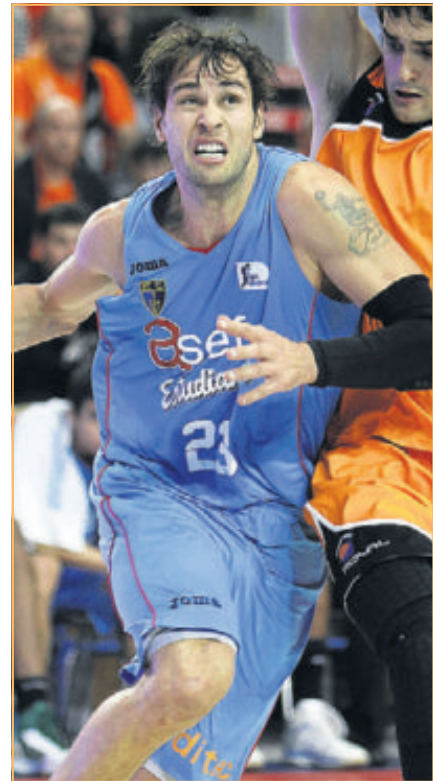
Oleson y English son dos tiradores aunque de características diferentes