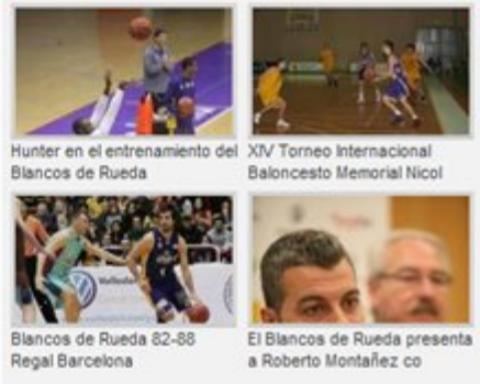
Hunter en el entrenamiento del Blancos de Rueda