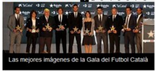
Las mejores imágenes de la Gala del Fútbol Català