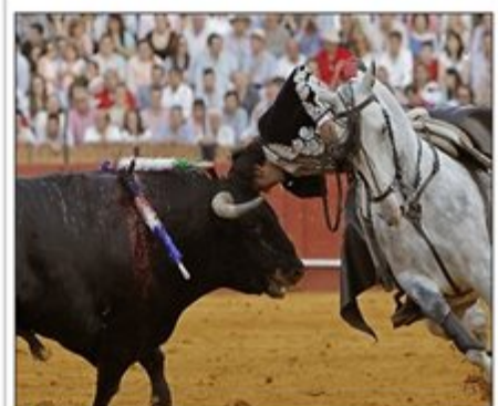
Sale por la Puerta del Príncipe