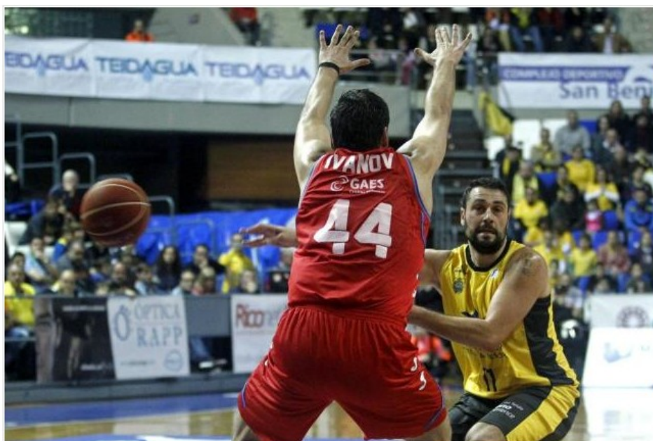
94-96. El Tuenti Estudiantes decidió en la segunda prórroga en Tenerife

La Laguna (Tenerife), 8 mar (EFE).- El Iberostar Tenerife cosechó una nueva derrota en casa, esta vez frente al Tuenti Móvil Estudiantes (94-96) después de dos intensas prórrogas.