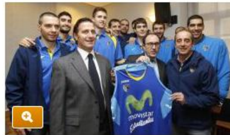
La plantilla colegial posa con la nueva camiseta.