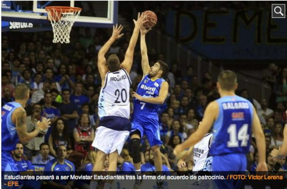
Estudiantes pasará a ser Movistar Estudiantes tras la firma del acuerdo de patrocinio.