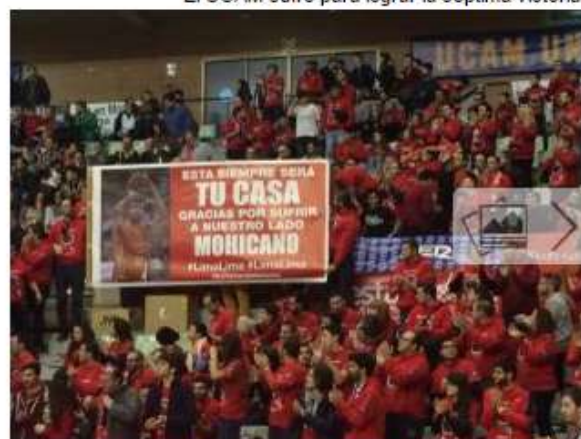
El UCAM sufre para lograr la séptima victoria