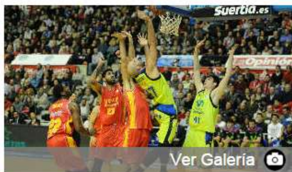
El UCAM sufre para lograr la séptima victoria

La mayor rotación de banquillo del UCAM ha sido determinante para sacar adelante un encuentro en el que los locales no han sido regulares, y donde los chispazos de calidad de algunos de sus jugadores han desnivelado el choque.