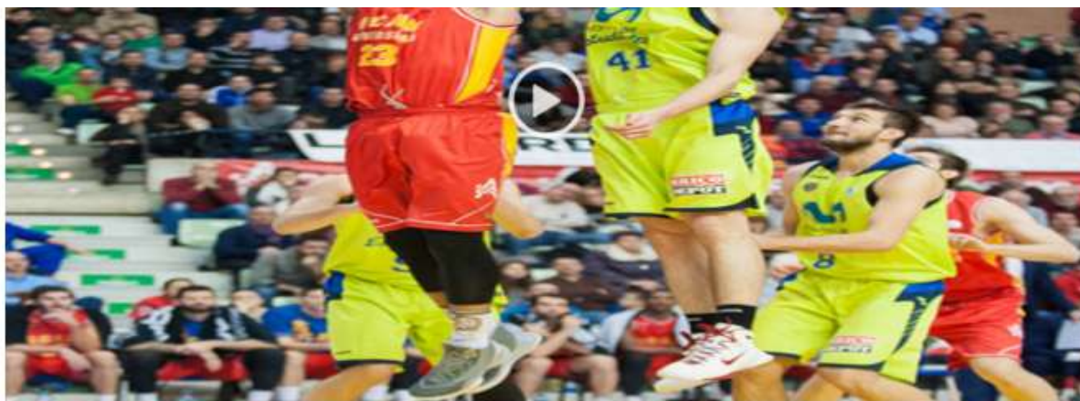
ACB: Resumen UCAM Murcia 83-70 Estudiantes