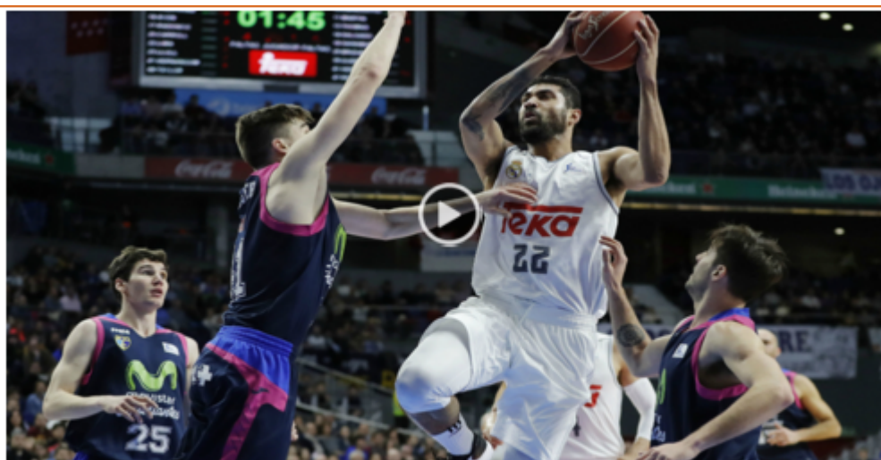
ACB: Resumen Real Madrid 97-79 Estudiantes