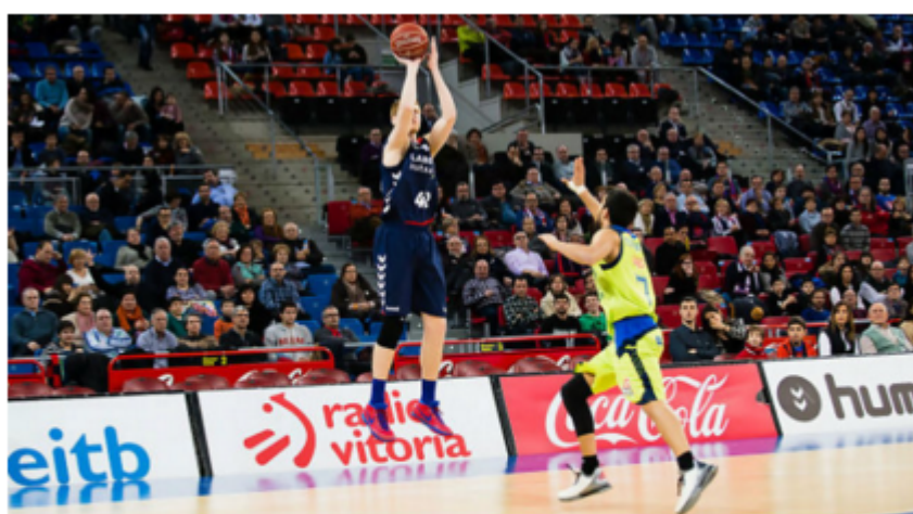
Laboral Kutxa - Estudiantes