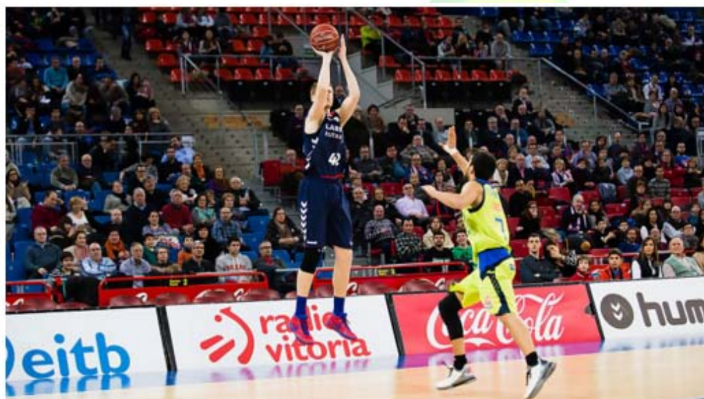
El Baskonia no tuvo rival ante Estudiantes.

La 17ª victoria del Laboral Kutxa ha llegado en esta jornada 21 de Liga Endesa tras vencer al Movistar Estudiantes, el cual no puso oposición alguna en ningún momento del encuentro. La diferencia entre ambos equipos se hizo visible desde los primeros compases del juego e iría en aumento a medida que transcurrían los minutos.