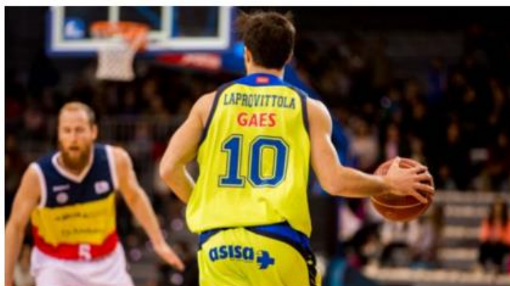
Andorra - Estudiantes