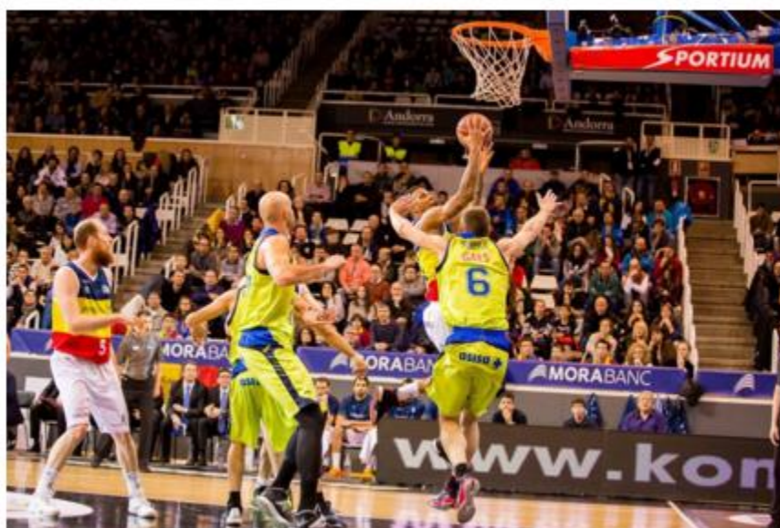
MoraBanc Andorra evita la remontada de Movistar Estudiantes