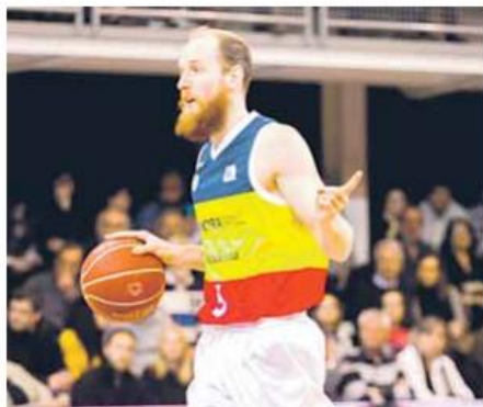
Schreiner, ahir

Del domini a l'angoixa El binomi Schreiner-Shermadini va ser el punt de partida, però l'ancoratge georgià no és cap secret en la lliga i Xavi Rey ho tenia ben estudiat. I el partit va començar a poc a poc però amb l'equip ben falcat al darrere (9-3). Els protagonistes eren Beto i Stojanovski –molt bona feina en