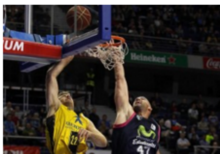
Imagen del encuentro de hoy | Gigantes

Iberostar Tenerife llegaba a la capital española para enfrentarse a Movistar Estudiantes en casa, algo que desde hace años impone a los equipos visitantes debido a la fervorosa afición estudiantil y la presión que esto puede suponer para los jugadores sobre la pista. Un domingo más, el Barclaycard Center estaba repleto, para disfrutar de un buen partido de baloncesto.