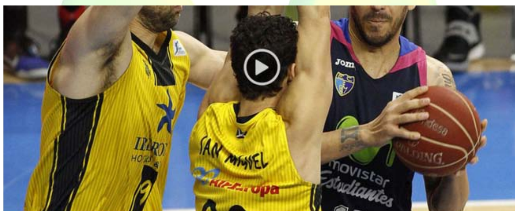
ACB: Resumen Estudiantes 80-84 Tenerife