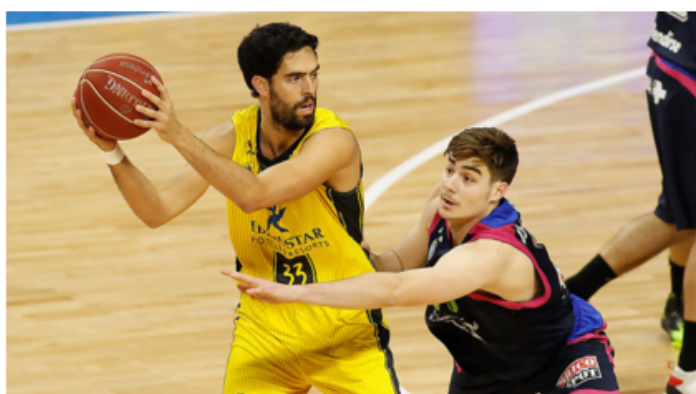
Estudiantes - Tenerife