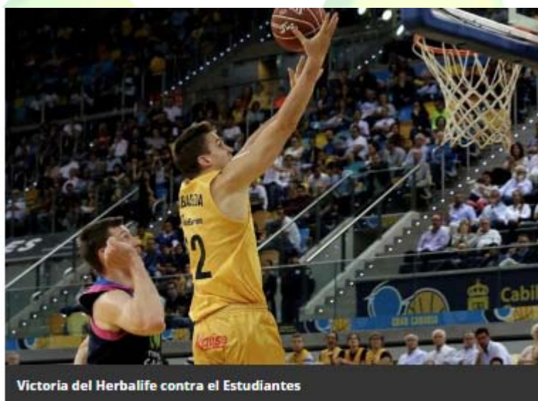
Victoria del Herbalife contra el Estudiantes