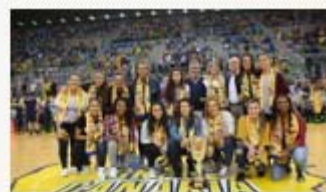
Herbalife Gran Canaria - Movistar Estudiantes