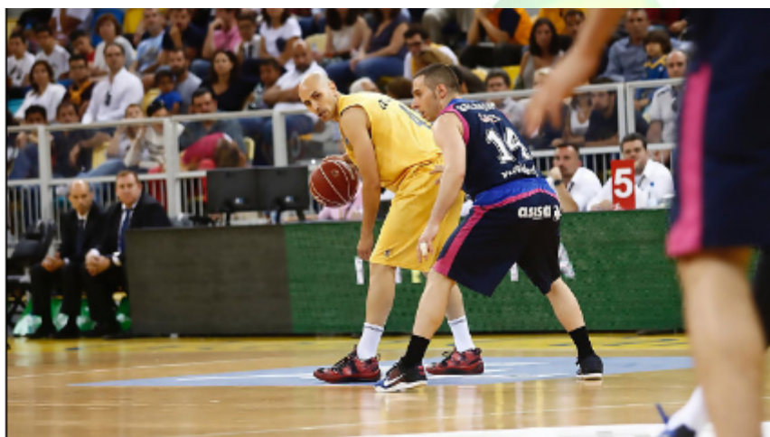
Dos clásicos midiéndose desde el puesto de base

Las Palmas de Gran Canaria, 8 Mayo 2016 (EFE). - El Herbalife Gran Canaria ha superado este domingo al Movistar Estudiantes por 82-80 en el Gran Canaria Arena y se ha asegurado la quinta plaza para el Playoff por el título de la Liga Endesa.