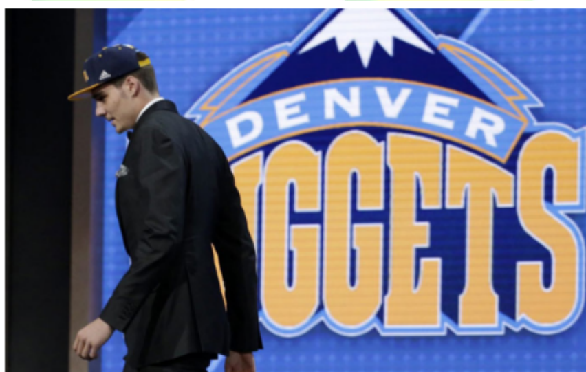
Juan Hernangómez