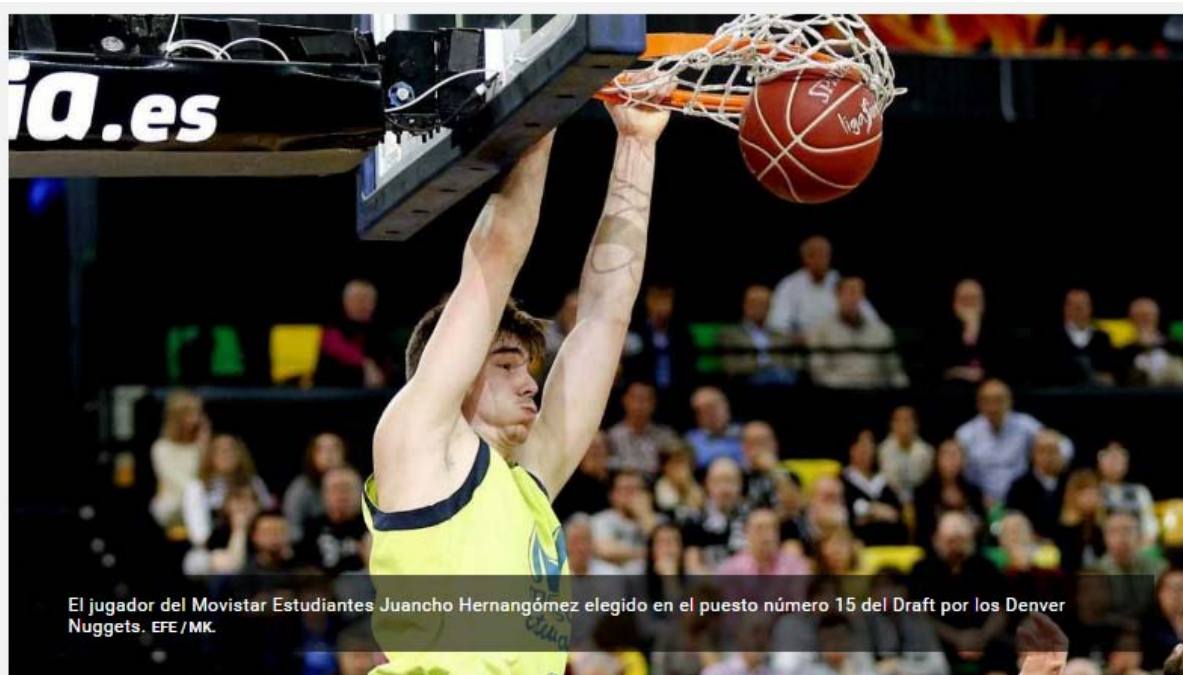
El jugador del Movistar Estudiantes Juancho Hernangómez elegido en el puesto número 15 del Draft por los Denver Nuggets.