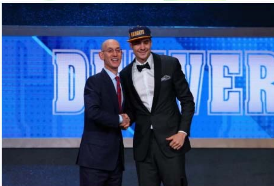
Juan Hernangomez, right, poses with Commissioner Adam Silver after being drafted 15th overall by the Nuggets on Thursday in New York.

Denver Nuggets 2016 draft class: Jamal Murray, Juan Hernangomez, Malik Beasley, Petr Cornelie