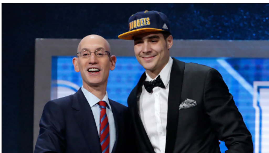
Juancho Hernangómez, con Adam Silver

Redacción, 24 Jun. 2016.- El Draft NBA del 2016 ha tenido bastante presencia 'española'. Por una parte, el jugador del Movistar Estudiantes Juancho Hernangómez ha sido elegido en el puesto número 15 por los Denver Nuggets. Y por otra, Domantas Sabonis , hijo de Arvydas y ex jugador del Unicaja, fue elegido en el puesto número 11 por los Magic, pero inmediatamente traspasado a los Thunder, junto con Oladipo e Ilyasova , por el hispano-congoleño, Serge Ibaka .