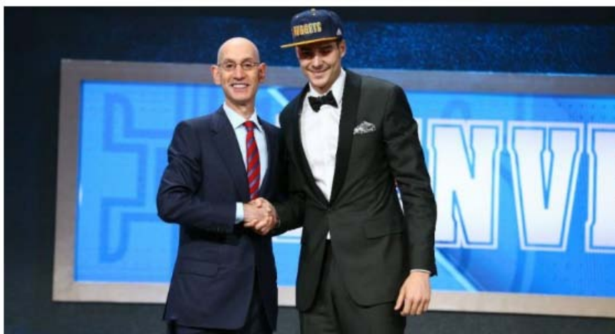
Juancho Hernangómez, elegido en el número 15 del draft. Así quedó el listado completo