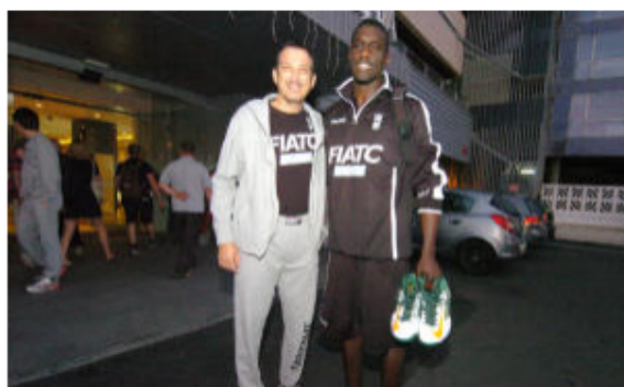
Savané, Maldonado y un mismo desti