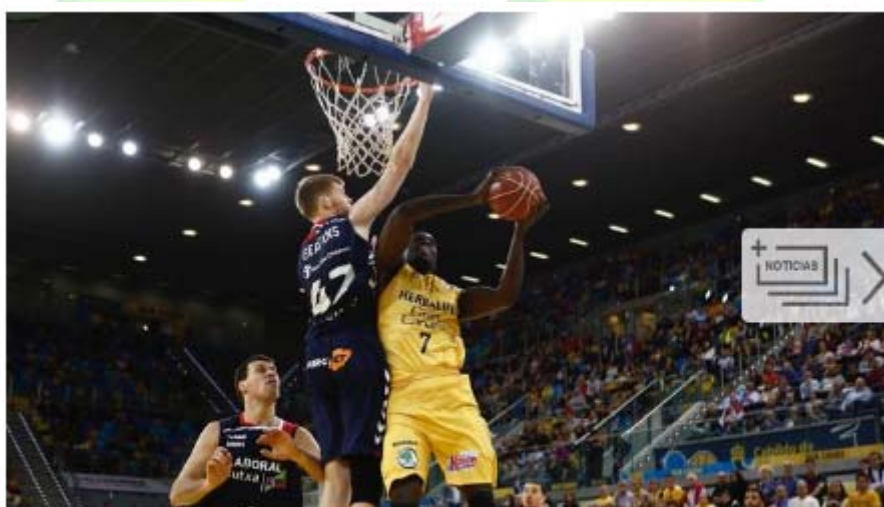
El pívot Sitapha Savané, cuarto refuerzo del Movistar Estudiantes MADRID | EUROPA PRESS