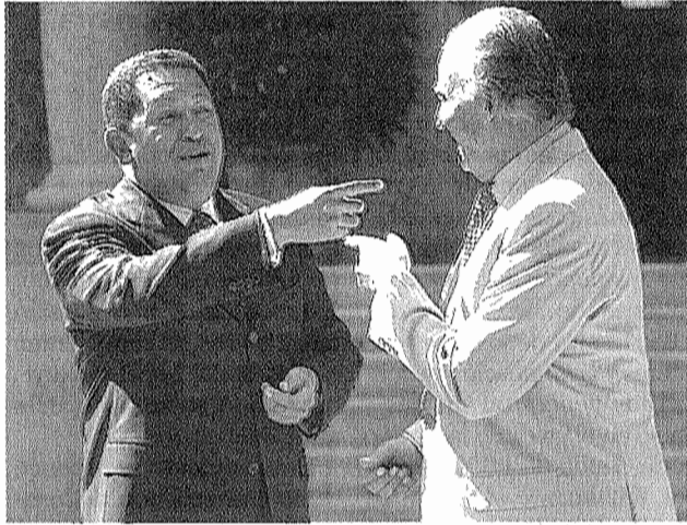
El Rey Juan Carlos y Hugo Chávez, en su reciente encuentro en Mallorca.

El reciente contrato anunciado por Venezuela da aire a Juliana, la factoría de Gijón adquirida hace dos años por Vulcano a la SEPI