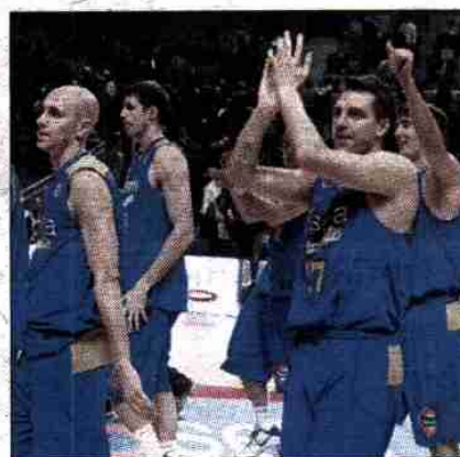
Sánchez celebra una victoria.