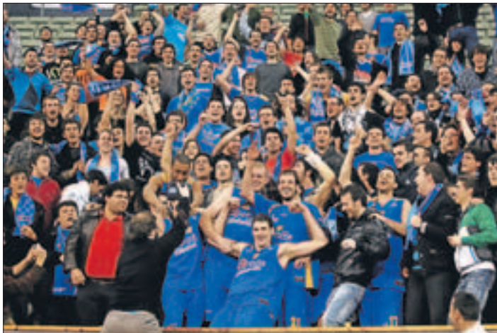
POR LA PUERTA GRANDE. Los jugadores lo celebran con la afición.